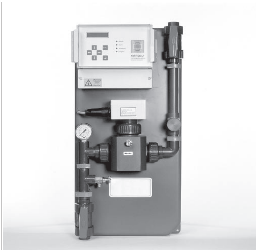
System VARITEC- LF-I-BP

Optimální číslo zahuštění leží mezi 2,0 a 4,0 a je závislé na kvalitě doplňované vody. Spíná-