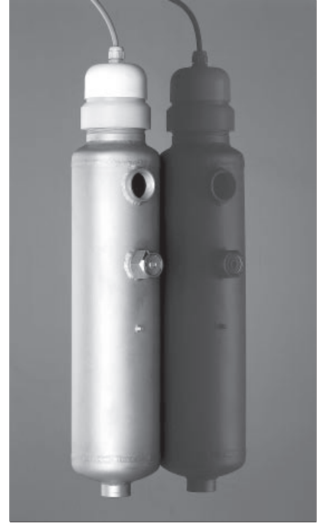
VARITEC UVE 20-R